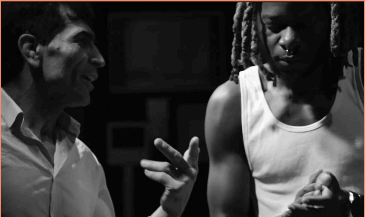
© Katerina Antonopoulou-Wiedenmayer - photos extraites du film «Un chant qui réunit»