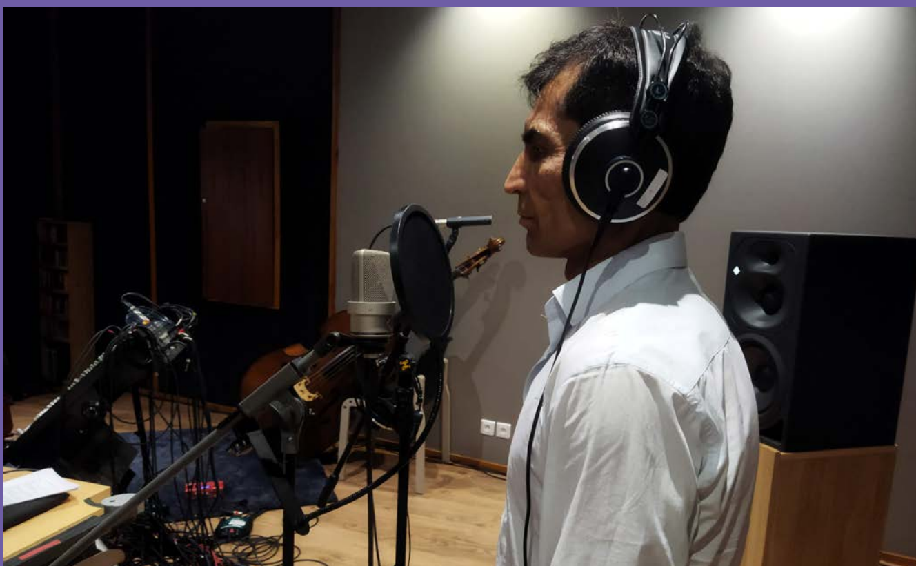
Quelques-un-e-s des participant-e-s accompagné-e-s de la compositrice et musicienne Ingrid Obled lors de la résidence au studio éole pour la création de la version radiophonique de «Un nom, une voix, un visage»