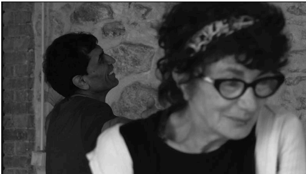
© Katerina Antonopoulou-Wiedenmayer - photo extraite du film «Un chant qui réunit»

« Ode à la vie , c'est un spectacle qui est le fruit d'une rencontre autour d'un atelier d'expression théâtrale. C'est aussi le désir de se retrouver deux samedis par mois, pour partager à l'instant ce qui surgissait des propositions. C'est l'occasion pour les participants de sortir de soi, de s'échapper du quotidien, de faire place à son imaginaire, à sa créativité.