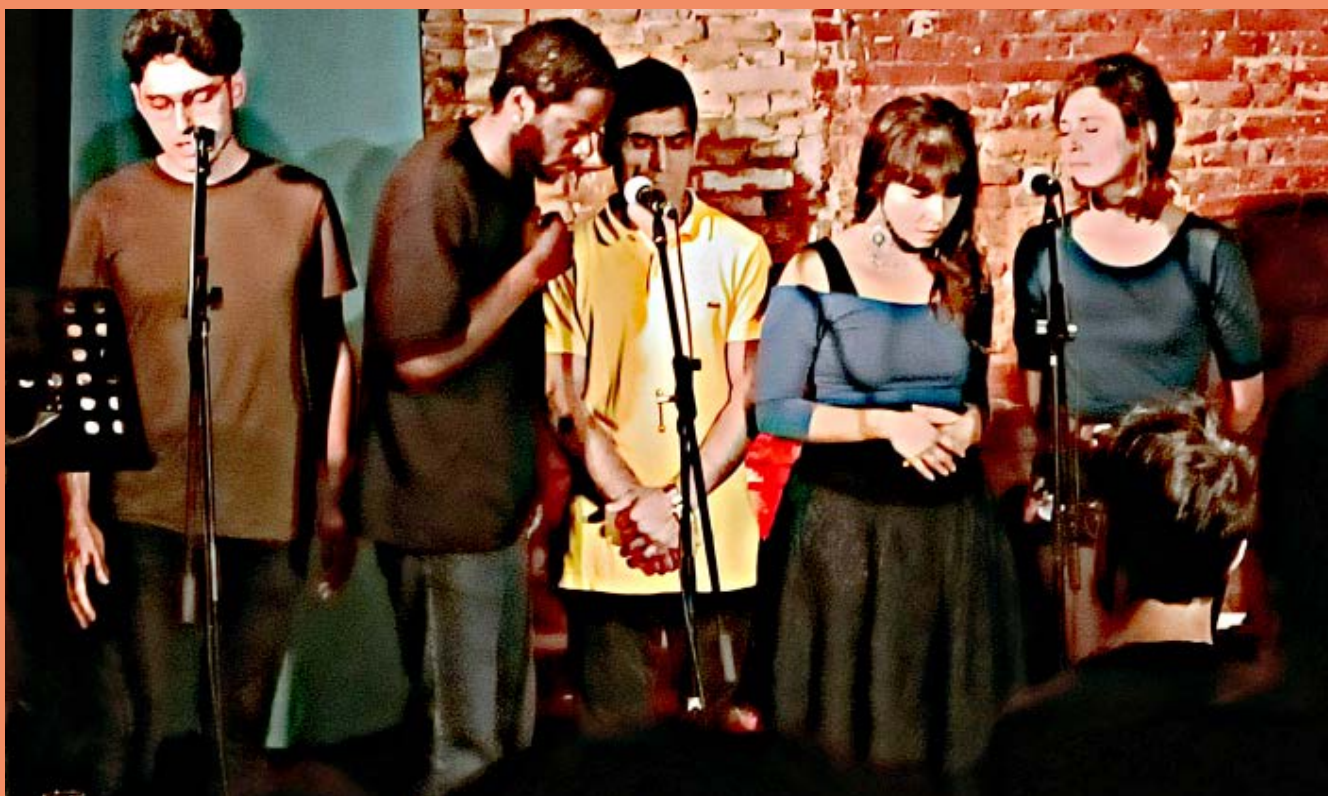
Lors du concert de paroles «Un nom, un voix, un visage» au Théâtre du Grand Rond le 14 octobre 2022