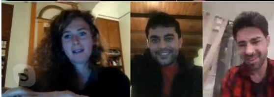
Lors d'un atelier d'écriture mené en visioconférence en avril 2020

Le reconfinement annoncé par le gouvernement le 28 octobre dernier, loin d'entraver la mise en place des ateliers prévus cette saison